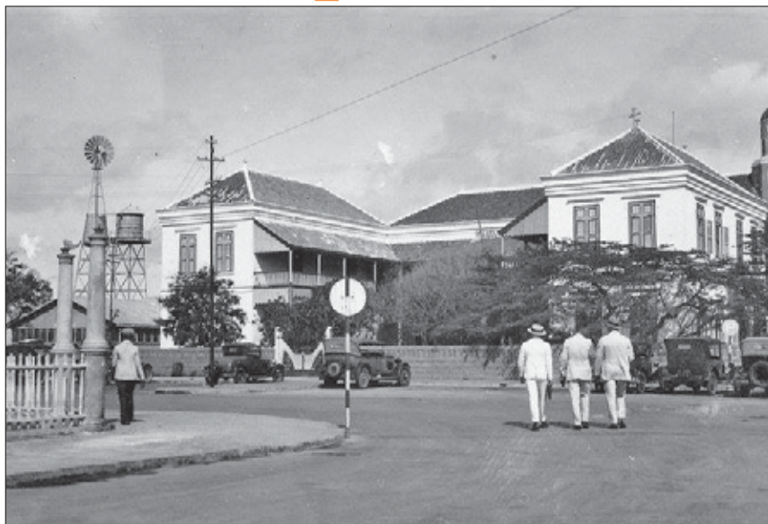
Zicht op de Wilhelminaschool voor burgermeisjes in de jaren twintig of dertig.